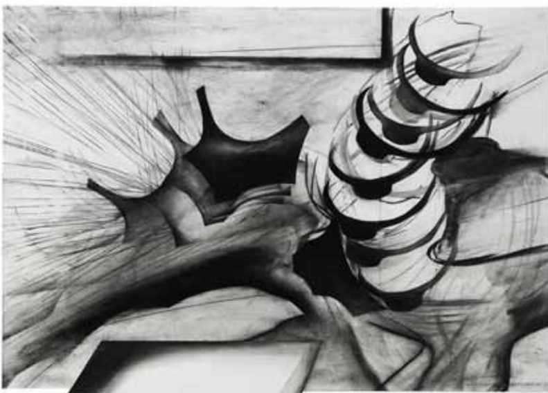
SEMNA VAN OOOY ← ACCIDENTAL 3 2013 HOUTSKOOL, SIBERISCH KRIJT OP PAPIER 100 X 70 CM ← ← LINKSOM 2012 UIT DE SERIE TAUROMAQUIA HOUTSKOOL, POTLOOD, SIBERISCH KRIJT OP PAPIER 95 X 77 CM