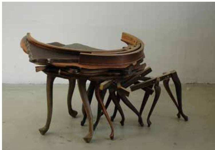
SEMNA VAN OOY 15-POOT RECHTSOM 2012 HOUT, 100 X 65 X 60 CM